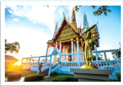
วัดหัวเขา ตำบล หัวเขา อำเภอเดิมบางนางบวช สุพรรณบุรี 72120 โทร. 035 470 047, 080 048 9828

เนื้อที่ตำบลหัวเขา มีเนื้อที่ ๖๕.๖๕ ตารางกิโลเมตร หรือประมาณ ๔๑,๐๓๑ ไร่