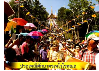
ประเพณีตักบาตรเทโวโรหณะ